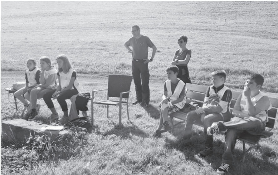
Rehkitze schützen, so geht das.

«Ich wusste auch nicht, dass vermähete Rehkitze, die dann auch noch «verhäxlet» werden, nachher im Futter zum Tod einer Kuh führen können».