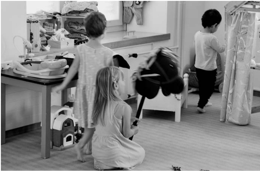
Die Wolfstätzli haben ein neues Zuhause