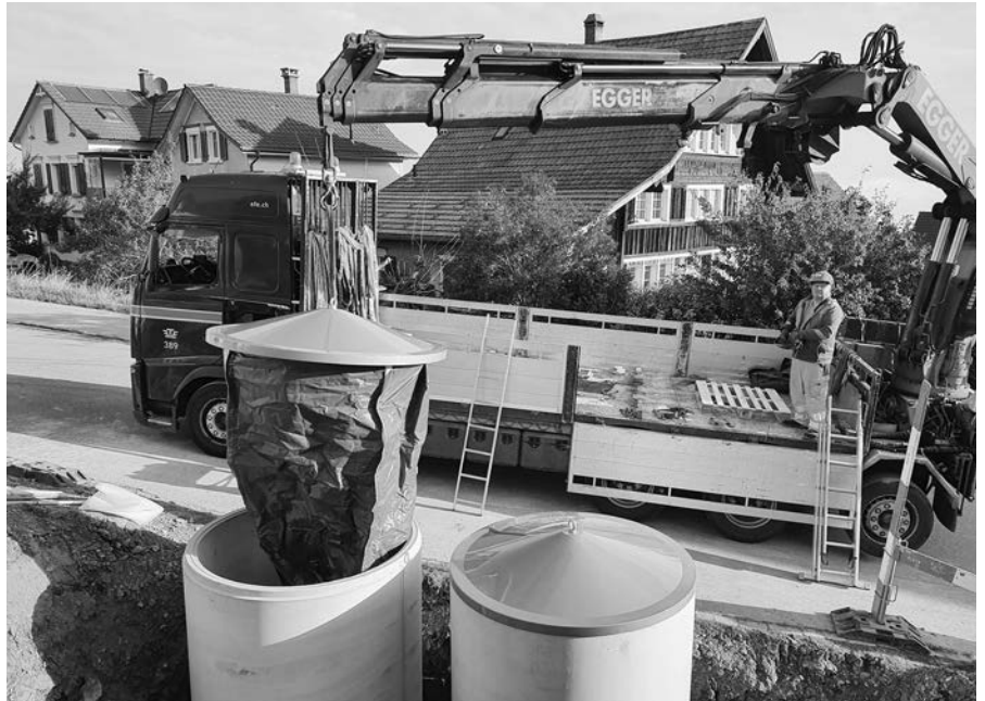
Neu bei der Einfahrt Kindergartenstrasse

Abfuhrtermin verpasst? Aufgerissener Abfallsack am Strassenrand? Dank den zwei neu gesetzten Halbunterflurbehälter (HUB) bei der Einfahrt in die Kindergartenstrasse gehören solche Probleme für die Anwohner der Vergangenheit an.