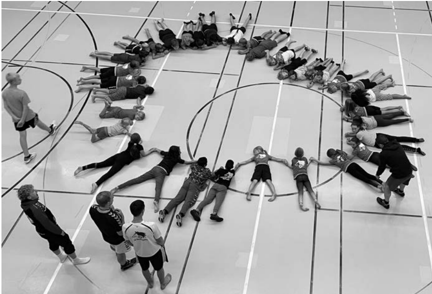
In der Turnhalle gespielt und übernachtet.

Am letzten Augustwochenende ist die Jugendriege Wolfhalden mit Sack und Pack losgelaufen. Eine Schnitzeljagd führte uns zum Fägnäscht Rorschach in den Trampolinpark. Wir verbrachten ein paar schöne Stunden im Trampolinpark. Danach fuhr uns das «Hädlerbähkli» und Postauto zurück nach Wolfhalden.