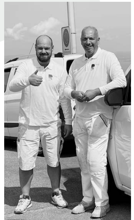
Das Einsatzteam der Pivac GmbH

lange, muss eventuell das Holz abgeschliffen werden, es entsteht Materialschwund. Hier lohnen sich regelmässige Wartung und Reinigungsarbeiten, nicht nur der Optik wegen sondern auch, um Kosten zu sparen. (LHH)