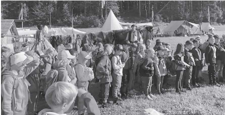
Eingeladen bei Indianern und Wikingern.

Am Freitag, 3. September 2021 besuchten der Kindergarten Zelg sowie die Unterstufe das Living History Camp.