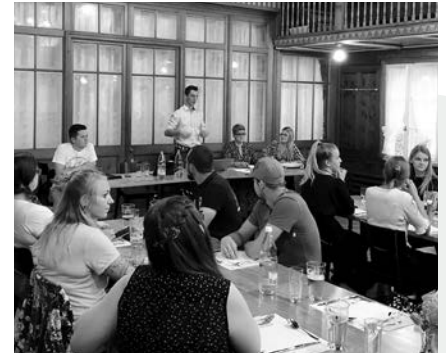
Wolfs-Hüüler im Lindensaal

Am Freitag, 20. August 2021 führte die Guggenmusik Wolfs-Hüüler Wolfhalden ihre 27. Hauptversammlung im Restaurant Linde in Heiden durch. Nach einer Saison 2020/21, die leider ausfiel, gab es nach langem Warten endlich wieder mal ein Treffen mit dem beinahe kompletten Wolfsrudel.