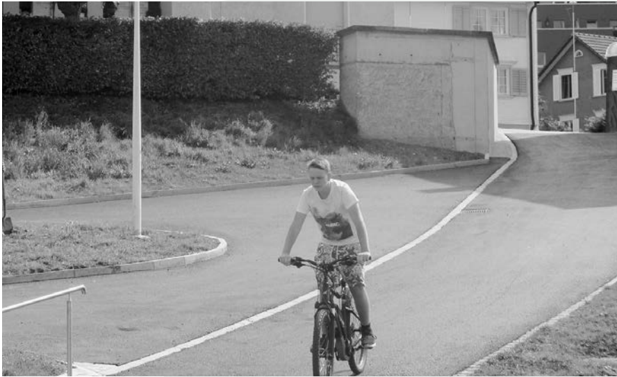
Seit Beginn des Schuljahres saniert.

Rechtzeitig auf den Beginn des neuen Schuljahres ist die von der Kirche zu den Schulhäusern der Ober- und Mittelstufe führende Gasse wieder offen. Vorgängig erfolgten umfangreiche Sanierungsarbeiten, was eine Sperrung des vielbegangenen Wegs nötig machte.