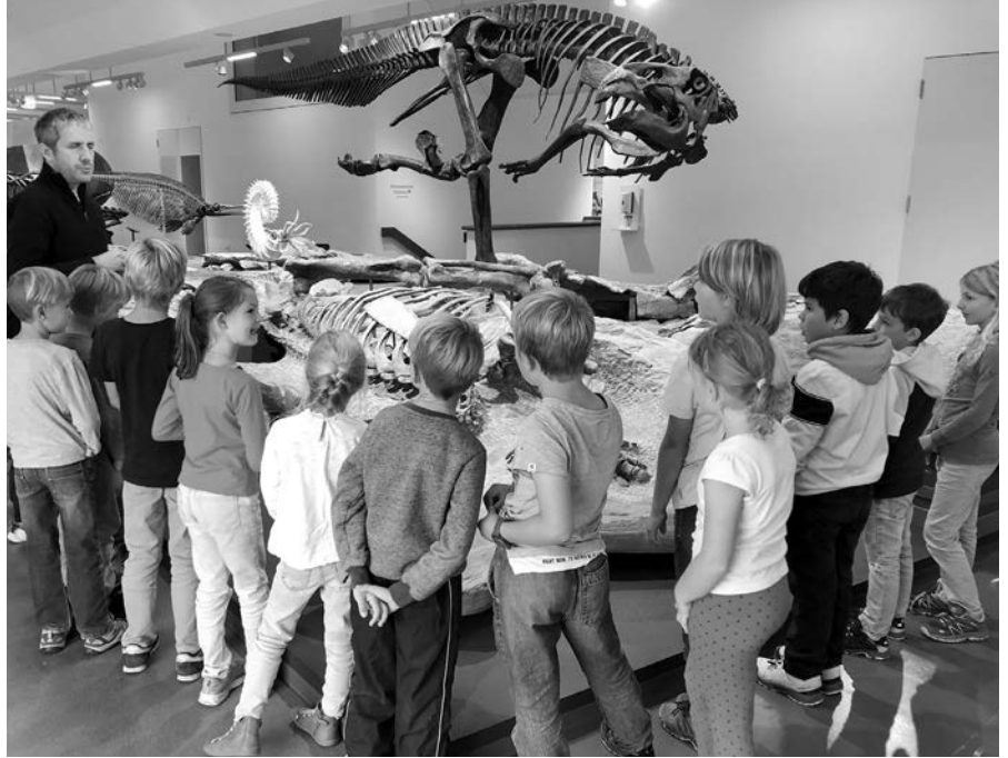
Die Kinder der 2. Klasse hören fasziniert dem Museumsführer zu.

Die 2. Klasse hat am Montag, 4. Oktober, das Naturmuseum St. Gallen besucht. Vom Ammoniten bis zum Entenschnabeldinosaurier erforschten die Kinder Wesen aus längst vergangener Zeit.