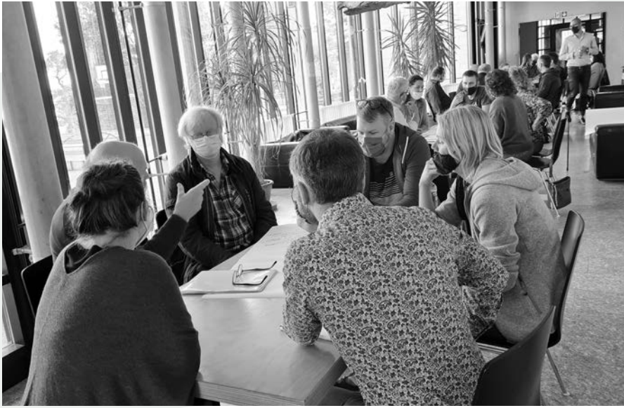
Mögliche Szenarien wurden in Gruppen diskutiert