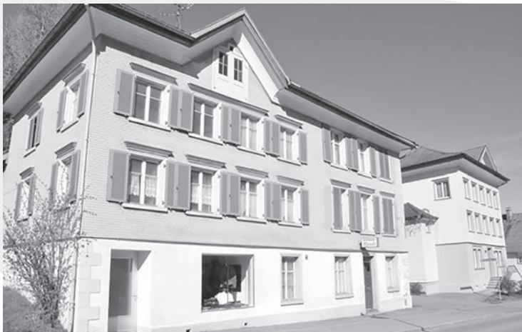
Ehemaliges Restaurant Rössli an der Obereggerstrasse 16 in Heiden