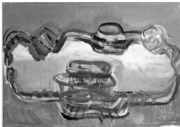
Maria Lassnig, Tischgesellschaft II

Zauberhaft an der Kulturvermittlung in der Schule ist der meist sehr offene, unkomplizierte Umgang der Kinder mit der Materie und der Person. Die 5.KlässlerInnen konnten sich gut mit Maria Lassnig identifizieren, die in ganz einfachen Verhältnissen in Kärnten aufwuchs und sich ihr Kunststudium durch Unterrichten verdiente. Spannend fanden sie ihre Entwicklung vom Figürlichen zum Abstrakten. «Sie molt immer schlinggiger, aber au