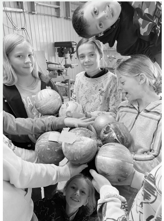
Maria Lassnig neu interpretiert: Die 5.Klässler mit ihren Christbaumkugeln.

Mit den Augen fühlen, war das Stichwort. Das habe richtig Spass gemacht, so der Tenor der konzentriert arbeitenden Truppe.