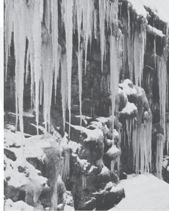
Die Kälte verwandelt

071 891 91 90 (Frau Hutter) oder info@weber-verwaltungen.ch (Herr Sulser)