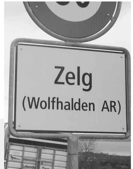
Zelg hat eine Innerortstafel erhalten. Erfolgt nun der Aufstieg zur eigenständigen Gemeinde?