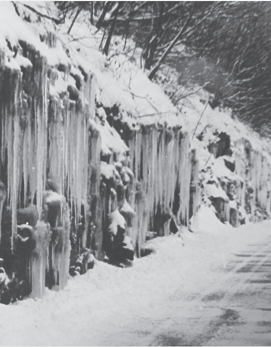
delte die Sonderstrasse in eine eindruckliche Eiszapfengalerie.