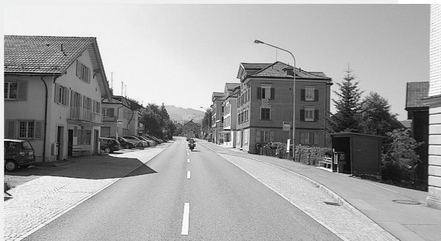
Die Bushaltestelle Dorf in Wolfhalden wird hindernisfrei umgebaut.

Das kantonale Tiefbauamt hat mit der Gemeinde Wolfhalden ein entsprechendes Umbauprojekt ausgearbeitet: Die Haltekanten sollen neu eine Höhe von 22cm haben, sodass ein niveaufreier Ein- und Ausstieg möglich wird. Weil die heutigen Busbuchten auf beiden Seiten für einen solchen Umbau zu klein sind, wird eine Fahrbahnhaltestelle realisiert. Die Sichtweiten und die Verkehrszahlen lassen das zu. Zudem sind in beide Richtungen die nachfolgenden Haltestellen weiterhin als Buchten geplant, sodass das Postauto dort überholt werden kann.