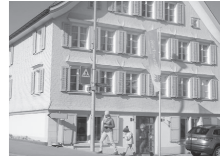
Das ehemalige Pfarrhaus im Dorfzentrum wird zum Wohngebäude