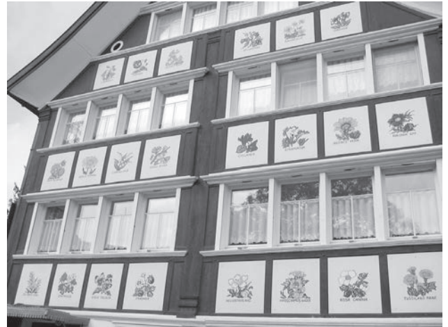
Die mit Heilkräutern geschmückte Hausfassade in Wolfhalden ist ein vielbewundener Blickfang, der an die grosse Ausserrhoder Tradition der Naturmedizin erinnert.

chenschaften fragwürdiger Heilerinnen und Heiler führten seitens der studierten Ärzte und vor allem auch ausserhalb des Kantons zu grosser Kritik. Klarheit schaffte dann die Landsgemeinde vom 30. April 1871 in Hundwil, als dem aus der Versammlungsmittel gestellten Antrag auf Freigabe der Heiltätigkeit mit grossem Mehr zugestimmt wurde. Entgegen dem Willen der Kantonsregierung war nun der Quacksalberei erst recht Tür und Tor geöffnet. Diese Zeiten sind aber