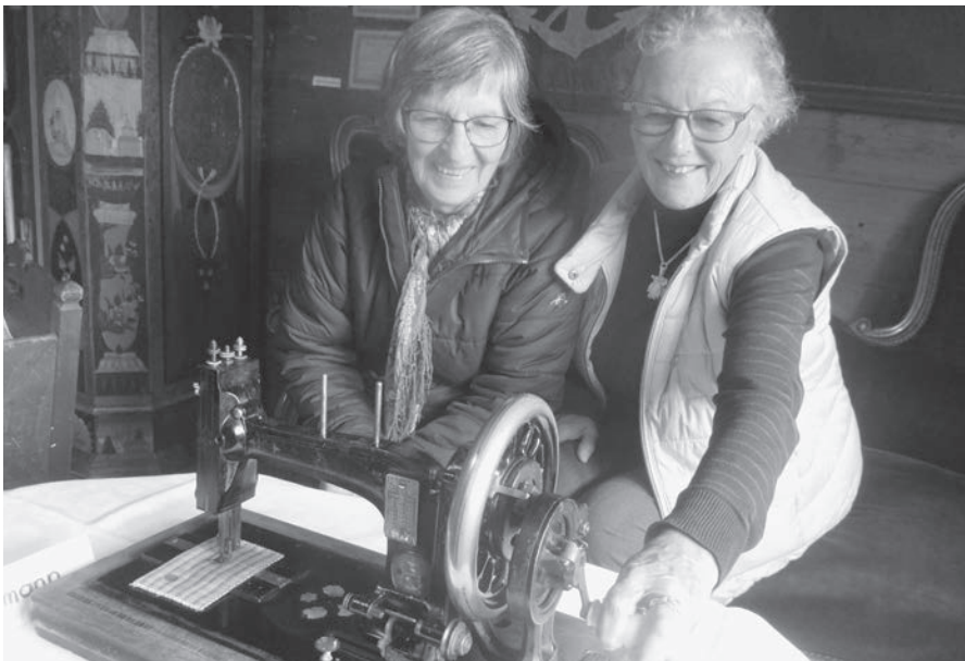
Zwei interessierte Besucherinnen lassen sich von einer Nähmaschine mit Handantrieb der Marke Naumann in die Vergangenheit entführen.

Geöffnet ist das Museum «Alte Krone» jeden Sonntag von 10 bis 12 Uhr. Bei Voranmeldung an Ernst Züst sind Besichtigungen auch anderntags möglich.