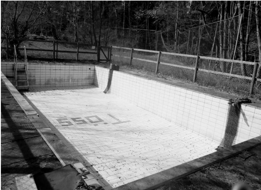
Das älteste Schwimmbad der Region Vorderland wurde 1909 im Schönenbühl erbaut.

Die Schwimmbäder sind wieder zugänglich. Geschlossen bleibt hingegen das 113 Jahre alte Bad im Schönenbühl, das die älteste Anlage dieser Art ist.