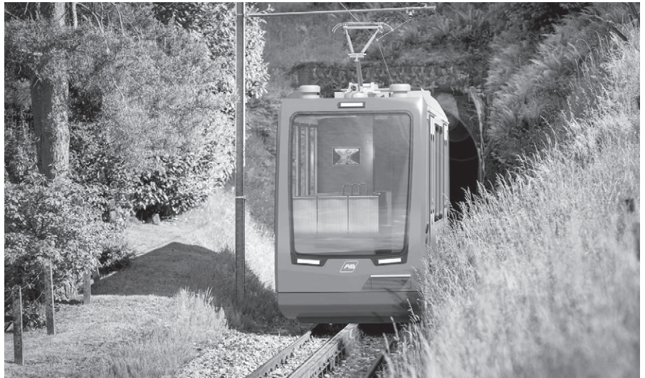
Visualisierung des neuen Fahrzeugs der Bergbahn Rheineck – Walzenhausen.

1896 wurde die Bergbahn Rheineck – Walzenhausen eröffnet. 1958 erfolgte die Inbetriebnahme des derzeitigen Fahrzeugs, das heute am Ende seiner Lebensdauer steht. Nachdem sich Bund, Kantone und Anrainergemeinden für den Weiterbestand der Bahn entschieden haben, setzen die Appenzeller Bahnen als Betreiberin der Linie Rheineck – Walzenhausen ein einzigartiges Projekt um: Künftig wird die neue Bahn das Unterrheintal mit dem Appenzeller Vorderland vollautomatisch und ohne Wagenführer verbinden. Mit dem neuen Schienenfahrzeug wird die erste vollautomatisierte Überland-Adhäsions- und Zahnradbahn der Welt entstehen. Die Produktion des Triebwagens erfolgt bei der unter anderem in St. Margrethen und Altenrhein ansässigen, auf Schienenfahrzeuge spezialisierten Firma Stadler Rail. Die Inbetriebnahme ist 2026 vorgesehen. Mit der neuen Bahn er-