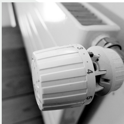
Mit einem Thermostatventil lassen sich die je nach Nutzung unterschiedlichen Temperaturen in den Zimmern regeln.

Tipps zum Energiesparen bietet auch der Bund: www.nicht-verschwenden.ch/