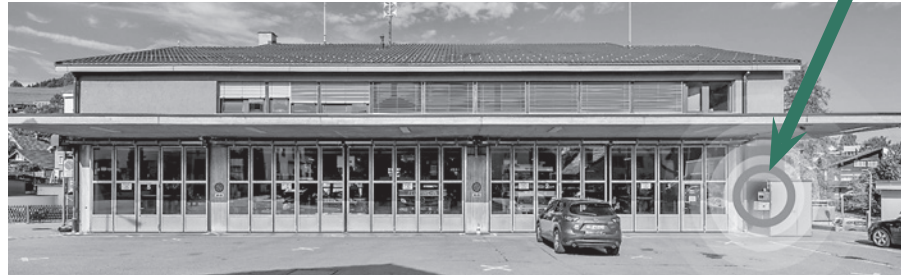
Der analoge Alarmknopf in Heiden ist gut sichtbar montiert und mit Licht, Bewegungsmelder und Videokamera ausgestattet.

So verfügt jedes der 16 Feuerwehrdepots im Kanton Appenzell Ausserrhoden über einen analogen Alarmknopf. Hierdurch können die Bürgerinnen und Bürger die Feuerwehr bei einem Ausfall des Telefonnetzes sofort alarmieren. Und