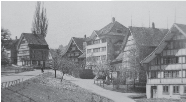
Nach dem Abbruch des Hauses wurde die Strasse begradigt und verbreitert.

Das Haus Bruggmann im Luchten wurde Ende Januar 1973 und damit vor fünfzig Jahren trotz grossem Widerstand abgebrochen. Grund war die Strassenkorrektur. «Zu den schönsten Strassen- und Siedlungsbildern im Appenzeller Vorderland gehört die Häuserzeile entlang der alten Landstrasse im