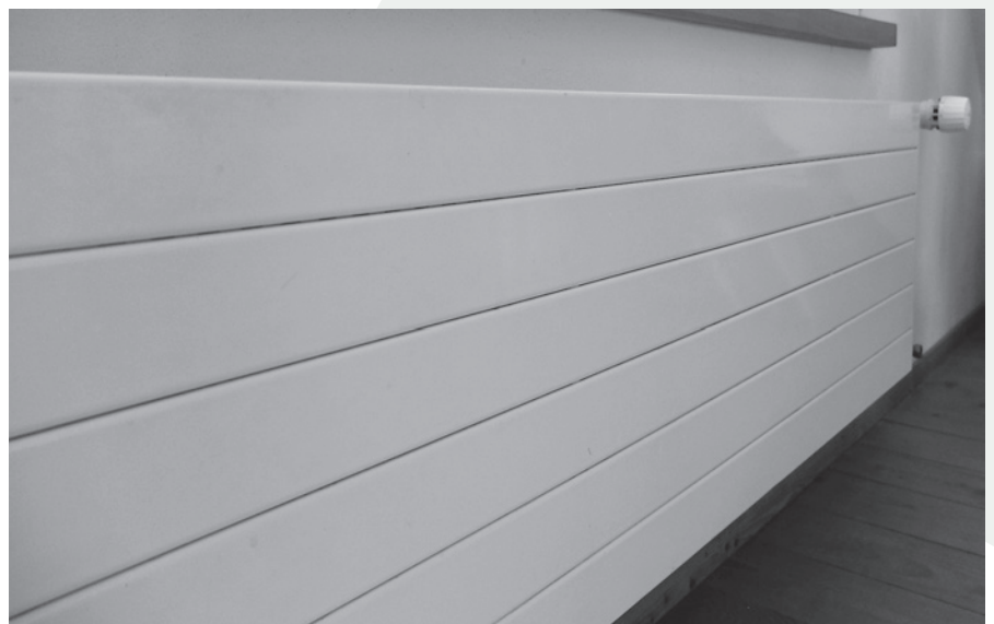
Die Heizkörper müssen frei sein, um die Wärme abgeben zu können.