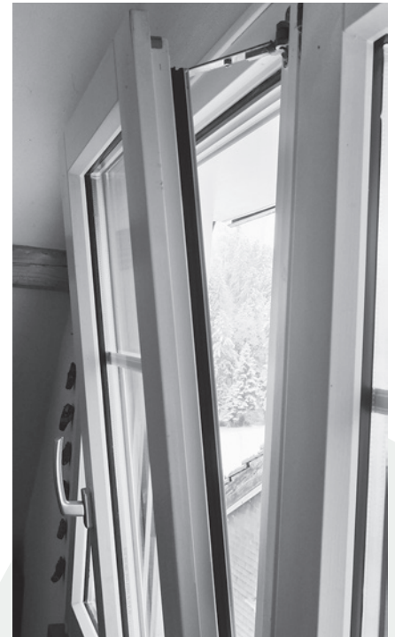
Beim offenstehenden Kippfenster geht Wärme ins Freie verloren, ohne dass sich im Raum die Luft erneuert.

Damit die Wärme im Haus oder in der Wohnung bleibt, empfiehlt sich zudem, in der Nacht Roll- oder Fensterläden zu schliessen.