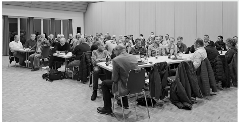
Wahlversammlung Wolfhalden 2023