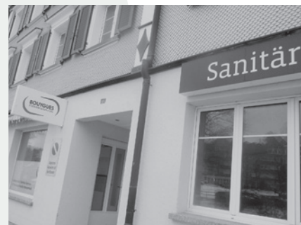
Noch immer beschriftet: Das Haustechnik-Unternehmen Bouygues AG (früher Elektro-Sanitär, dann Alpiq) hat Wolfhalden verlassen.