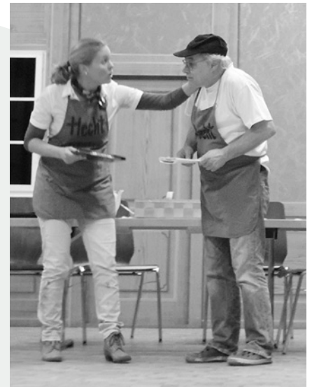
Bei den Proben werden einigen Gemeinderäten die Kräfteverhältnisse schmerzlich bewusst