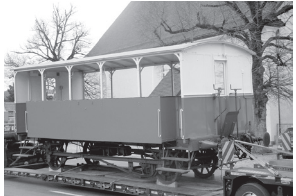
Ein aus dem Gründungsjahr 1875 stammender Wagen der «Hädler Bahn» war auf der Strasse zwischen Rheineck und Heiden unterwegs.

Ein wuchtiger Sattel-schlepper transportierte einer der Eisenbahnwagen aus dem Gründungsjahr 1875 nach Heiden, nachdem dieser vorgängig bei der Firma Kläsi Fahrzeugbau AG in Amriswil einer Auffrischung unterzogen worden war. Der seltene Anblick erinnerte an die seinerzeitigen Pläne einer Strassenbahn von Rheineck via Lutzenberg und Wolfhalden nach Heiden. Bereits 1906 aber wurde ein Autobus-Betrieb eröffnet, womit das Bahnprojekt fallen gelassen wurde.