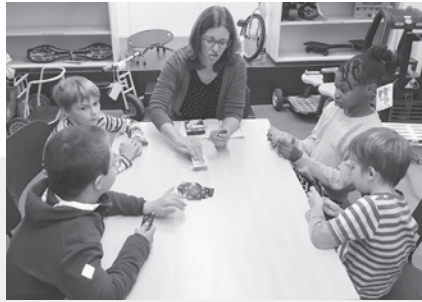
In den Frühlings- und Sommerferien bietet die Ludothek Rheineck Spielvormittage für Kinder an

Bisher hatte die Ludothek Rheineck via Ferienpass jeweils in den Herbstferien einen Spielvormittag für Kinder angeboten. Weil diese grossen Anklang fanden und die Plätze ausgebucht waren, hat sich das Ludo-Team entschieden, künftig in den Frühlings- und Sommerferien selber einen solchen Spielvormittag anzubieten. Diese finden am Donnerstag, 13. April 2023, sowie am Donnerstag, 10. August 2023, jeweils von 8.30 bis 11.20 Uhr in der Ludothek statt.