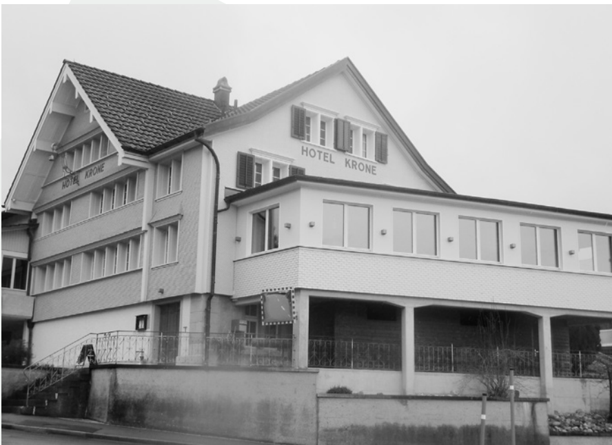
Die seeseitige gedeckte Aussichtsterrasse gehört zu den Attraktionen des Landgasthofs Krone, die leider bis auf weiteres geschlossen ist.

Zu den arbeitsintensiven Geschäften des von Gino Pauletti präsidierten Gemeinderats gehört das Projekt «Zukunft Schule Wolfhalden». Zur Diskussion stehen unter anderem Neubauten für die Mittelstufe und den Kindergarten. Geprüft werden gleichzeitig Zusatznutzungen zur Aufwertung des Dorflebens. Weiterer Knackpunkt sind die bislang weitgehend fehlenden Parkplätze bei den Schulhäusern, die zusätzliche Parkflächen und bessere Zufahrten erhalten sollen. Nach der Erarbeitung sämtlicher Grundlagen hat die Stimmbürgerschaft zu einem entsprechenden Projekt samt Planungskredit Stellung zu nehmen. Text und Bild (egb)