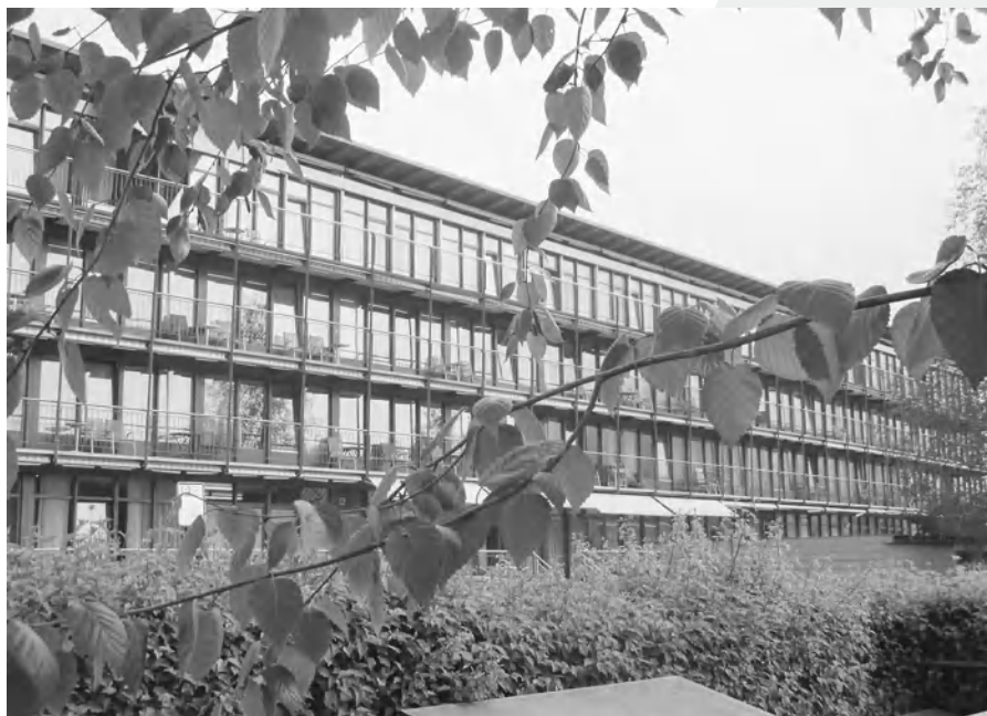
Das 1993 fertiggestellte Vorderländer Betreuungs-Zentrum in Heiden feierte das 30-jährige Bestehen.

2005 erfolgte die Umbenennung in Betreuungs-Zentrum Heiden (BZH), an dem alle Vorderländer Gemeinden einschliesslich Oberegg beteiligt sind.