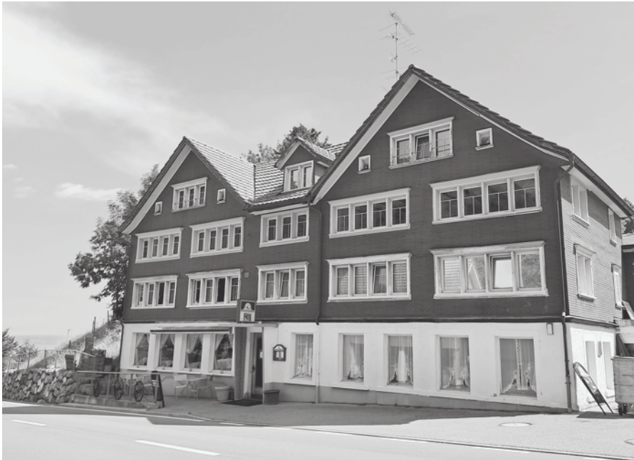
Restaurant Blume im Plätzli, Wolfhalden

Elf Monate war das Restaurant geöffnet, nun schliesst das Restaurant Ende Sommer seine Türen.