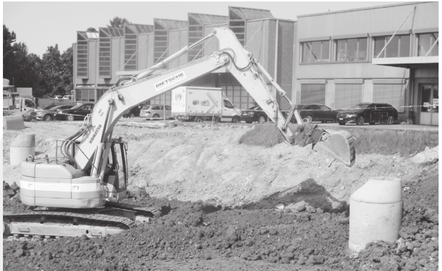
Die Feindrahtweberei G. Bopp & Co. im Mühltofel, Wolfhalden, wird als Folge der steigenden Nachfrage markant erweitert.