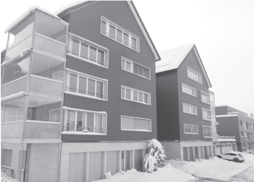
Ende 1998 und damit vor 25 Jahren waren die Wohnungen der Genossenschaft Alterssiedlung Kronenwiese bezugsbereit.

Ende 1998 konnten die gegenüber der Kirche erstellten Wohnungen bezogen werden. Das stattliche Doppelgiebelhaus wurde im Auftrag der Genossenschaft Alterssiedlung Kronenwiese erbaut.