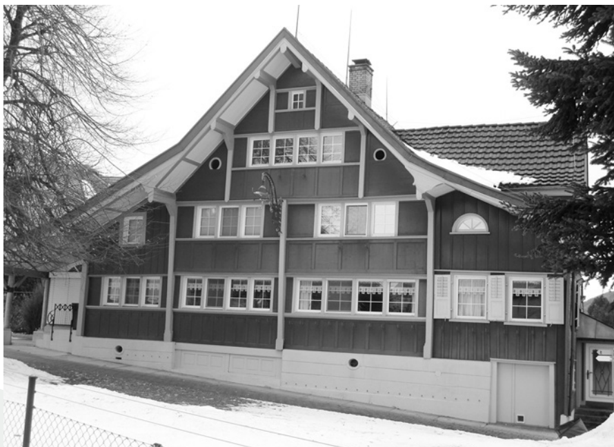
Im zweiten Halbjahr waren Bäckerei und Café Hecht geschlossen. Einheimische und auswärtige Kundinnen und Kunden hoffen auf eine baldige Wiedereröffnung.