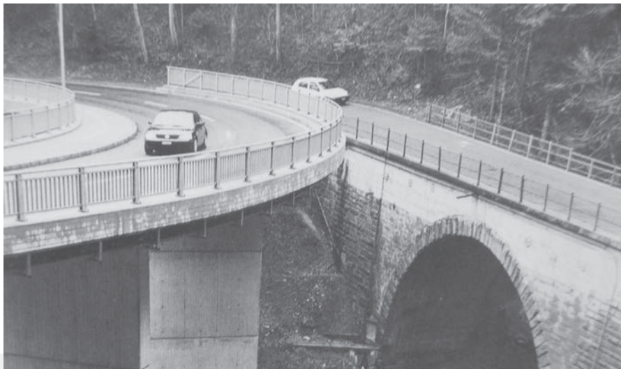
Ein Bild mit Seltenheitswert: Im Jahr 2000 wurde in der Bruggmühle die neue Brücke eingeweiht und später die alte abgebrochen.