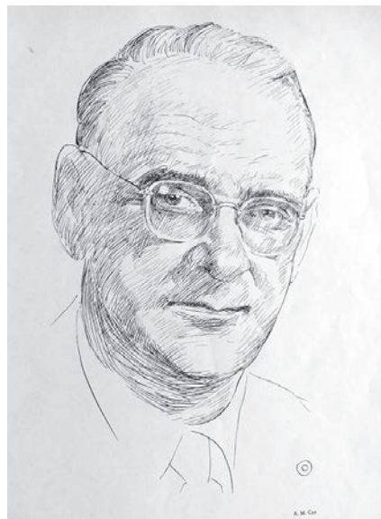
Generalconsul Carl Lutz (1895-1975),