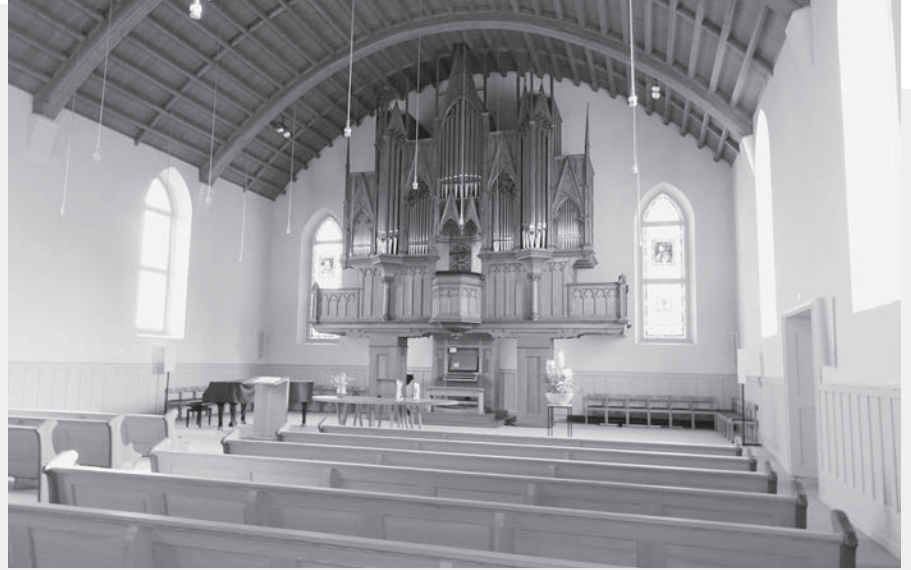
Im Zentrum der Innenrestaurierung von 1975 stand die Rückführung des neugotischen Orgelprospekts in den Urzustand.