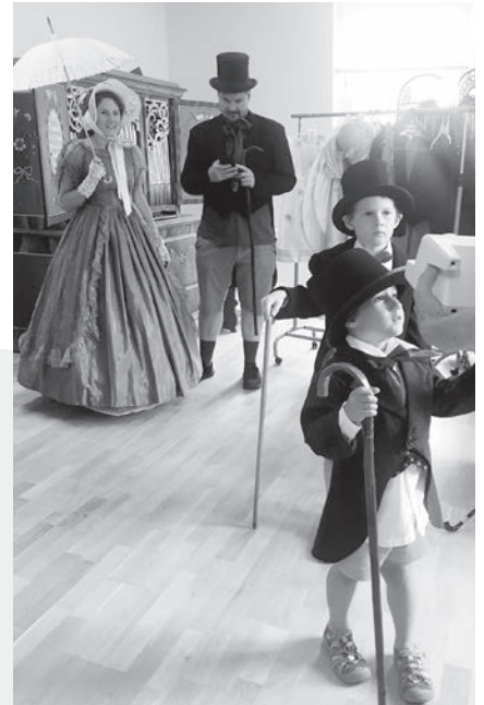
Gute Stimmung beim «Biedermeieren» im Museum Heiden

Es ist erstaunlich, was das Verkleiden mit den Leuten macht! Die ganze Körpersprache verändert sich. Und die Stimmung bei dieser Verkleiderei ist grossartig und heiter. Noch nie wurde im Museum so viel gelacht! Für kleinere Kinder gibt es auch ein Bilder-Suchspiel, mit dem sie selbständig das ganze Museum erforschen können. Diese dritte Auflage ist die letz-