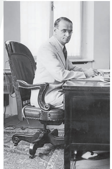
Bildlegende: Carl Lutz in seinem Büro in der amerikanischen Gesandtschaft in Budapest.