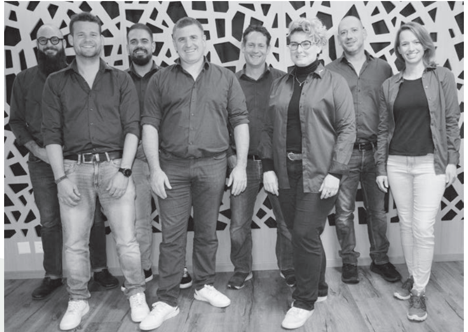
Ok der Gwerb25 von links nach rechts:

Am Sonntag wird vor der Messeöffnung ein festlicher Gottesdienst mit musikalischer Beglei-