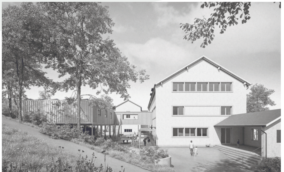
Visualisierung temporäre Schulbauten beim Mittelstufenschulhaus