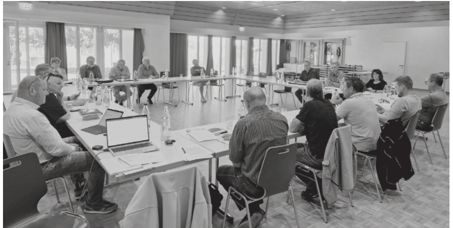
Die verschiedenen Anspruchsgruppen im Dialog.

Am 20. September fanden sich der Gemeinderat und Vertretungen aus der Geschäftsprüfungskommission, der SP und SVP, der Lesegesellschaften Aussertobel und Tanne, des Kantonsrats, des Handwerker- und Gewerbevereins und der Alp- und Landwirtschaftlichen Genossenschaft im Kronensaal zum Austausch und zur strategischen Weiterentwicklung der Gemeinde Wolfhalden ein.