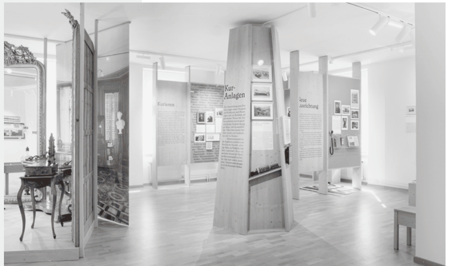
Einblick in die Ausstellung zur historischen Tourismusblüte in Heiden

Das Museum Heiden ist über die Festtage am Mittwoch, 24. Dezember, Donnerstag, 25. Dezember, Freitag, 26. Dezember sowie am Donnerstag, 1. Januar, jeweils von 13 bis 16 Uhr geöffnet. Im Übrigen gelten die Winteröffnungszeiten: Mittwoch, Samstag und Sonntag jeweils von 13 bis 16 Uhr.