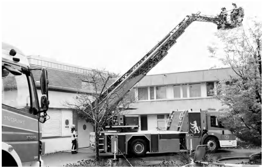
Die neue Autodrehleiter bewährte sich

Erstmals war an der Hauptübung nach der Fusion der Zug Nord vom Depot Nord, sprich Walzenhausen, mit dabei. Premiere hatte weiter eine Drohne, die zu einem grösseren Überblick verhelfen konnte.