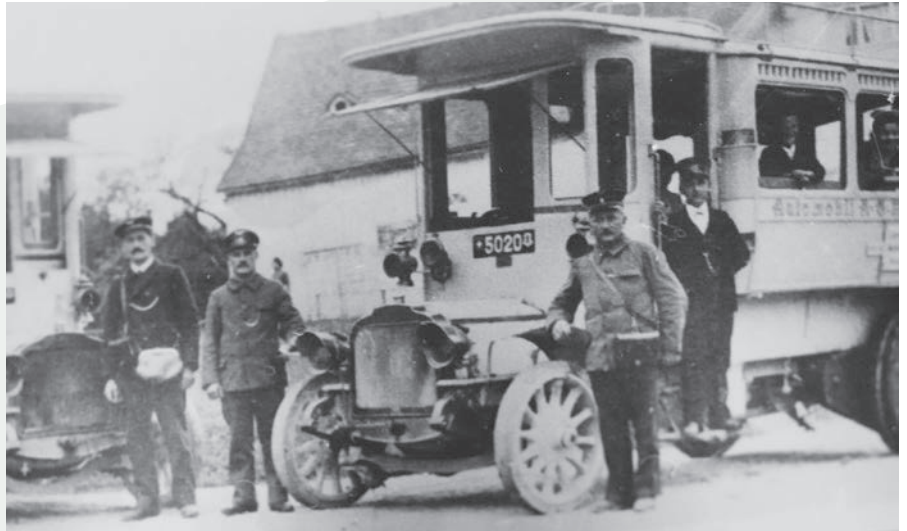
Das Personal mit den Martini-Wagen, die von 1906 bis 1921 fahrplanmässig die Linie Heiden-Rheineck bedienten.