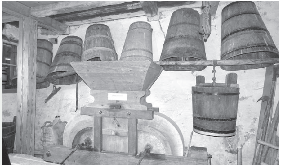
Eimer mit Tragstangen

Zwischen 2022 und 2025 wurde der umfangreiche Sammlungsbestand systematisch erfasst. Über 2'000 kulturhistorische Objekte aus dem 17. bis 20. Jahrhundert wurden inventarisiert, fotografiert und digital in der Datenbank MuseumPlus