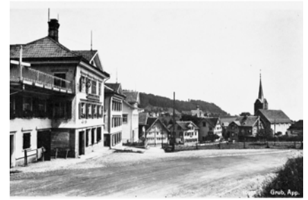
Grub mit der alten Dorfstrasse und der Kantonsstrasse um 1900.

Einschneidende Auswirkungen für Grub hatten die beiden Schiedsgerichts-Entscheide der Eidgenos-