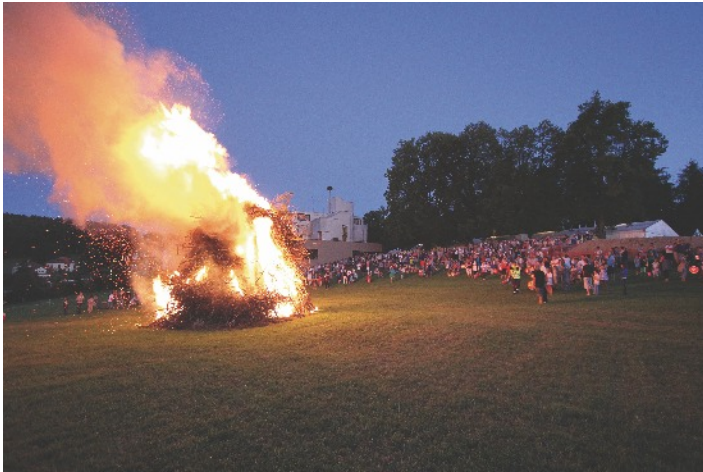
Der Funken ist entzündet

Im Rahmen der Veranstaltungen rund um 500 Jahre AR-AI, trafen sich zahlreiche Mitglieder der Gemeinden Grub und Lutzenberg mit den Wolfhaldenern am 1. Augustnach-