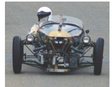
Morgan Three Wheeler, Jg. 1933,