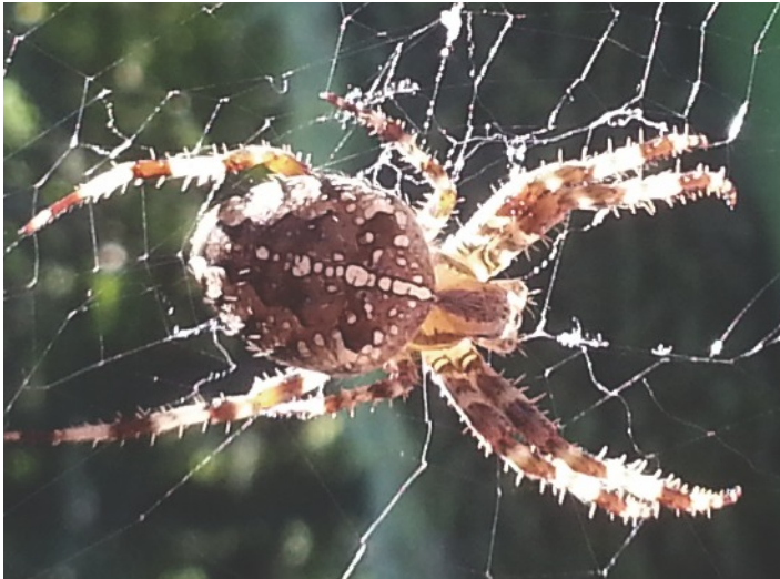
Walburga Cantieni, Kreuzspinne im Vorderhasle, Wolfhalden