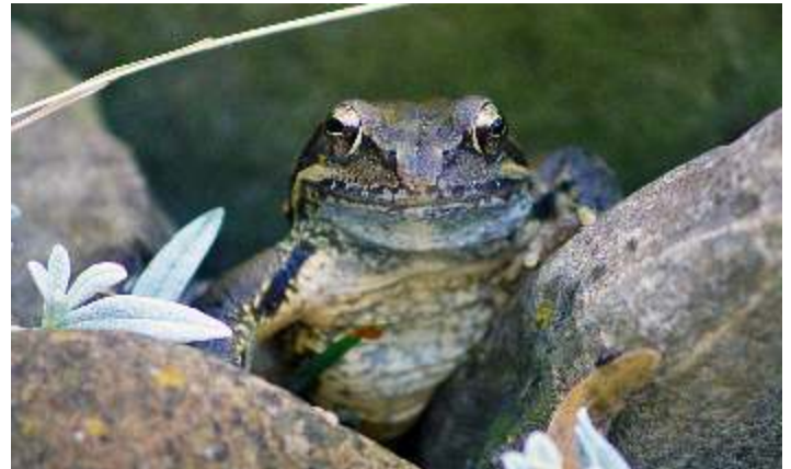
Birgitta Vuissa, Wolfhalden, Ein Frosch im Vorgarten