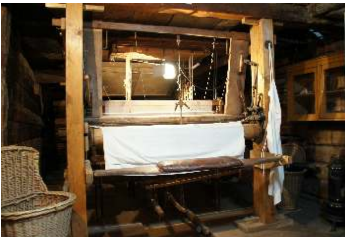
Einer der letzten Seidenwebstühle von 1920-30, 500 St. waren in Wolfhalden

Gezeigt wird Kinderspielzeug von anno dazumal.