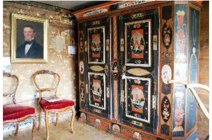
Ein Hochzeitschrank aus dem Jahre 1811