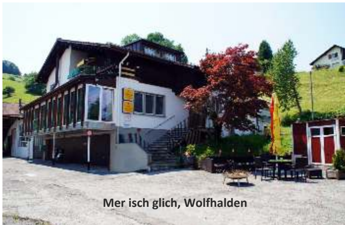
Mer isch glich, Wolfhalden