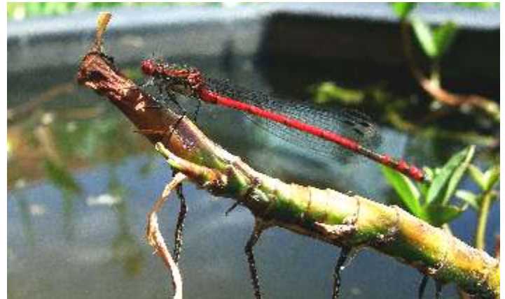
Gabi Buff, Wolfhalden, Libelle am Minitteich

Haben Sie einen Schnappschuss gemacht und möchten ihn zur Veröffentlichung schicken? Bitte als Anhang info@wolfsblick.ch oder per Post an: Richard Vuissa, c/o Redaktion Wolfsblick Alte Landstrasse 24, 9427 Wolfhalden, Telefon 071 891 31 48