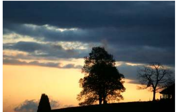
Jürg Kellenberger, Wolfhalden, Stimmungsbild

Ihr Anlass: Kino mit Bar zu vermieten!!! Verlangen Sie eine unverbindliche Offerte. 071 891 36 36