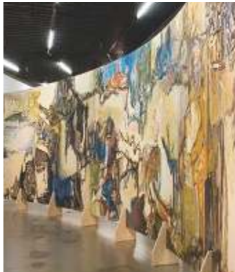
Bild die Installation von Luzern 2014