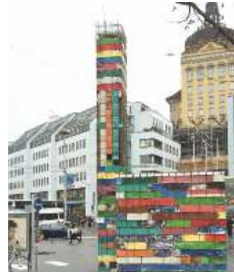
Bild die Installation von Luzern 2014