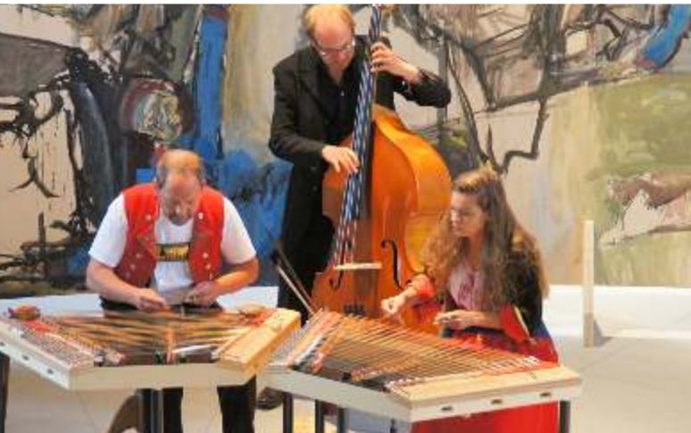
musikalische Gäste: Trio Anderscht