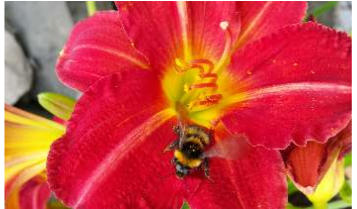
Markus Sturzenegger, Wolfhalden