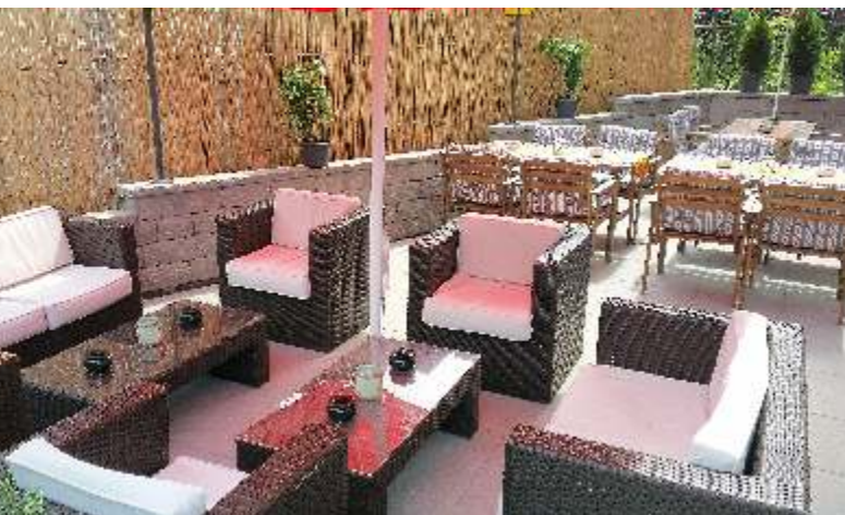
Total neu ist die gemütliche Gartenwirtschaft mit schwellenlosem Zugang zum Restaurant.

Die "Bierquelle" an der Obereggerstrasse in Heiden erstrahlt in neuem Glanz, nachdem das Haus innen und aussen umfassend saniert worden ist.