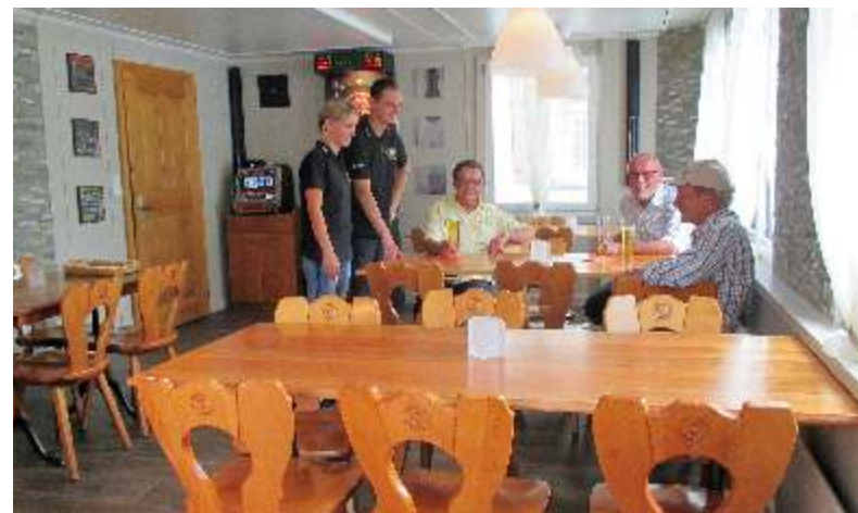
Trotz einer Reihe von Erneuerungen ist die "Bierquelle" nach wie vor ein heimeliges Quartierrestaurant.

"Das Haus war alt, teilweise baufällig und mit all den Treppen, Schwellen und den altertümlichen Toiletten im Zwischengeschoss schwer zu