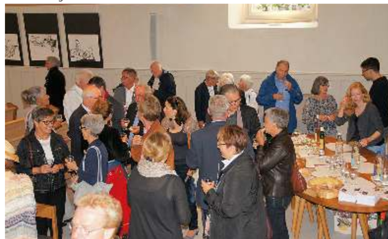
Das Buffet ist eröffnet

SOLFERINO - "Die Sonne des 25. Juni beleuchtet eines der schrecklichsten Schauspiele, das sich erdenken lässt. Das Schlachtfeld ist allorten bedeckt mit Leichen von Menschen und Pferden. In den Strassen, Gräben, Bächen, Gebüsch und Wiesen, überall liegen Tote, und die Umgebung von Solferino ist im wahren Sinne des Wortes mit Leichen übersät. Getreide und Mais sind niedergetreten, die Hecken zerstört, die Zäune niedrigerissen, weithin trifft man überall auf Blutlachen." (aus Henry Dunant: Eine Erinnerung an Solferino.)