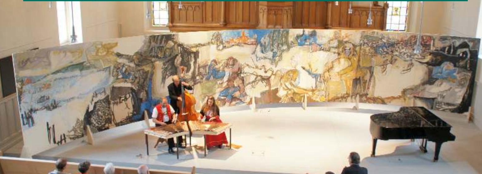
Kunst-Installation "Solferino" des Schweizer Künstlers Max Hari; auf einer Breite von 13,2m und 2,7m Höhe die beidseitig besichtigt werden konnte