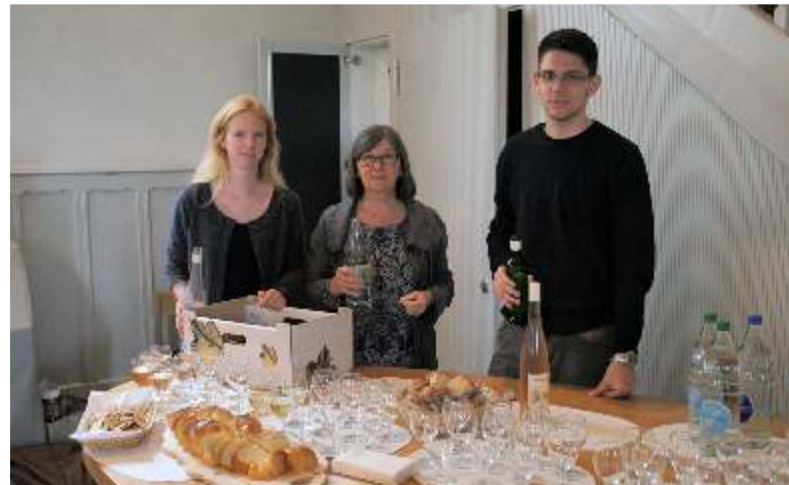
Der Tisch ist gedeckt