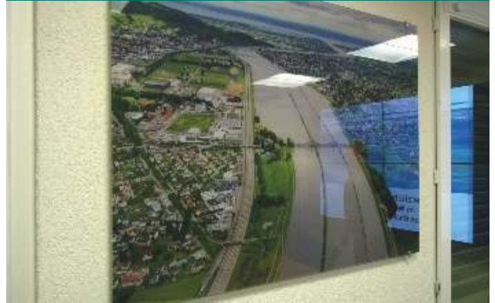
Hochwasser Widnau 2016

Am 18. November erhielten wir einen interessanten Einblick in das Mutterhaus des Rheinunternehmens in Widnau. Claudio Senn erzählte sehr ausführlich und sehr interessant über den Hochwasserschutz zwischen der Schweiz und Österreich dem Rhein entlang.