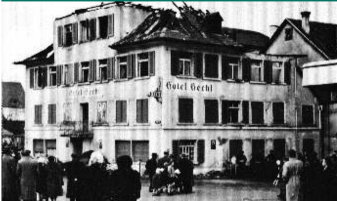
Die "Hecht"-Brandruine zog auch viele Schaulustige aus Wolfhalden an.