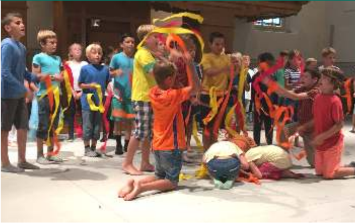
Schlussvorführung der Unterstufe zum Jahresthema der vier Elemente.