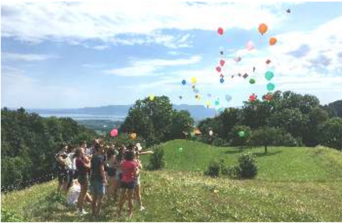
Verabschiedung des Schuljahres 16/17 der Oberstufe mit fliegenden Wünschen für den neuen Schuljahresstart.