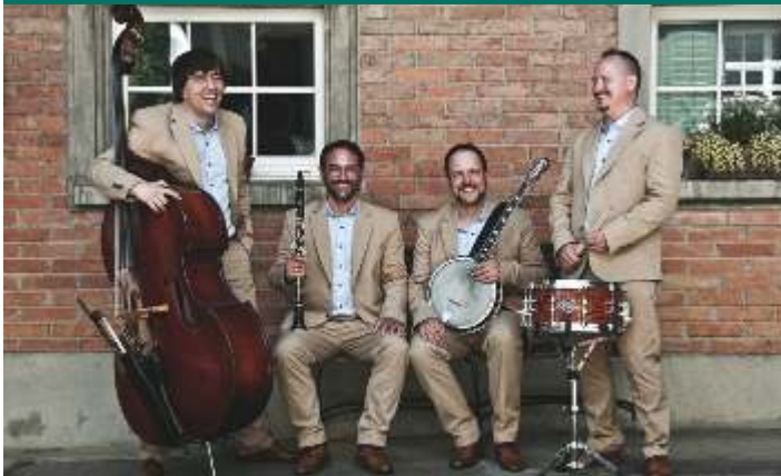
Bild: Cheibe Choge - optimierte Schweizer Volksmusik mit Spiel Freude, Virtuosität und Humor präsentiert.

Am Samstag, 20. Januar erwartet Sie um 20:00 Uhr im Kursaal Heiden eine neuartige und abwechslungsreiche Mischung aus Tradition, Innovation und Kundennähe - kurzum: optimierte Schweizer Volksmusik. Cheibe Choge sind vier Ostschweizer Musiker, betrieblich-hierarchisch aufgestellt - was an der Höhe ihrer Notenpulte zu