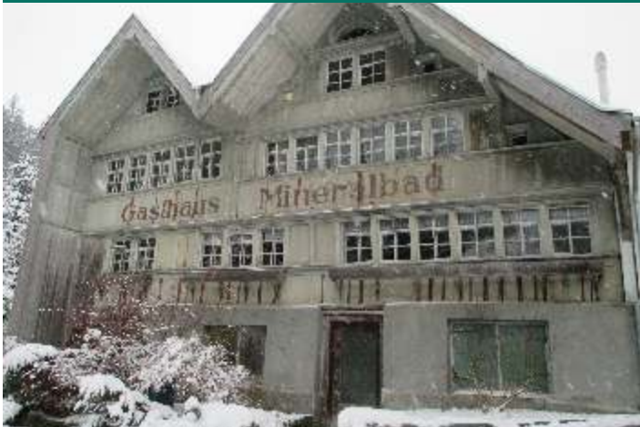
Das zweigiebelige Restaurant "Mineralbad" ist ein seltener Zeuge der einst grossen Appenzeller Kurbadtradition.

Das "Mineralbad" bleibt offen. Zu den ältesten Wirtschaften im Appenzellerland gehört das traditionsreiche "Mineralbad" ob Heiden.