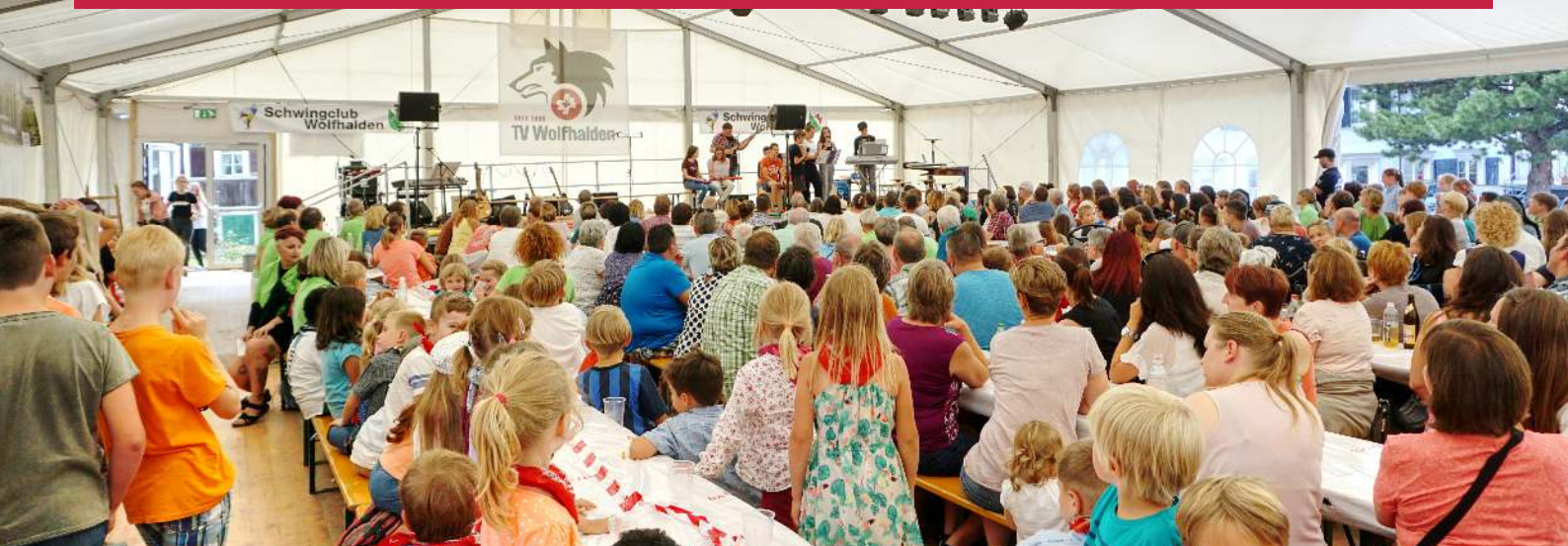
Da war ja was los in Wolfhalden: Auf der Suche nach dem schnellsten Wolfhändler 2018