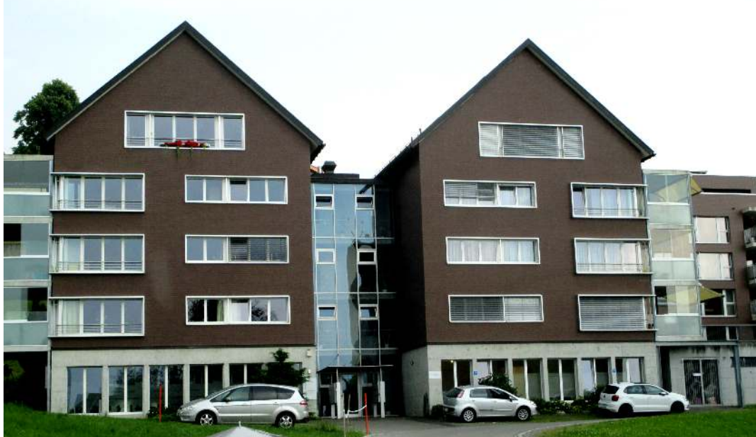
Im vergangenen Winter hat sich die im Mehrfamilienhaus der Genossenschaft Alterssiedlung Kronenwiese, Wolfhalden, installierte Erdwärmeheizung bewährt.

Anfang 2018 konnte im gegenüber der Kirche gelegenen Haus "Kronenwiese" eine Erdwärmeheizung in Betrieb genommen werden. Die Neuerung hat ihre Feuerprobe glänzend bestan-