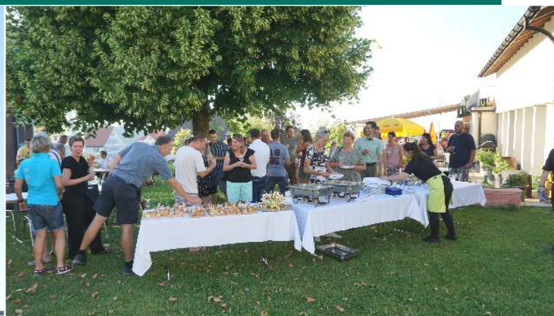
Beim dem alljährlichen Neuzuzüger-Apéro im Juni begrüßten der Gemeinderat verschiedene Vereinsvorstände und Gewerbetreibende die über 30 neuen Einwohner.