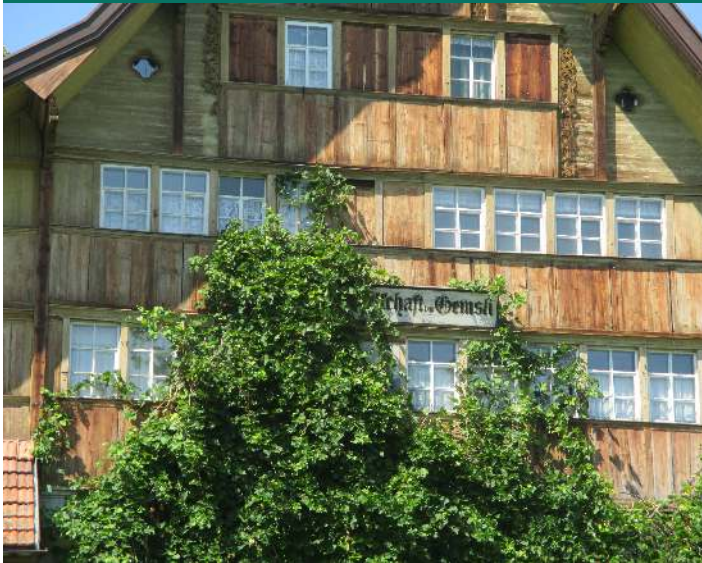
Reben des einstigen Weinbergs erobern die Hauptfassade des Kulturobjekts "Gemsli" in Zelg-Wolfhalden.