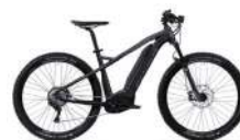
Flyer Uproc 2 statt Fr. 4000.- jetzt Fr. 3299.- (Farbe und Ausstattung kann vom Bild abweichen)