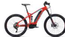
Flyer Uproc 7 statt Fr. 5000.- jetzt Fr. 3999.-

Öffnungszeiten: Di-Fr 9-12 und 14-18 Uhr, Sa 9-13 Uhr