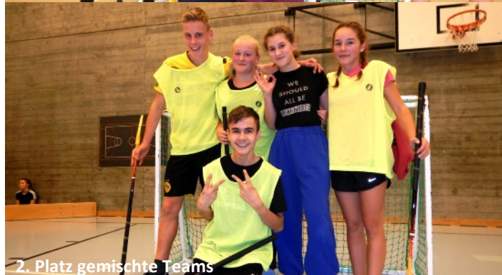
2. Platz gemischte Teams