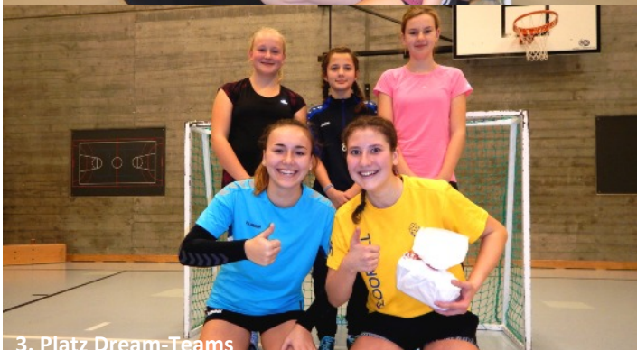
3. Platz Dream-Teams