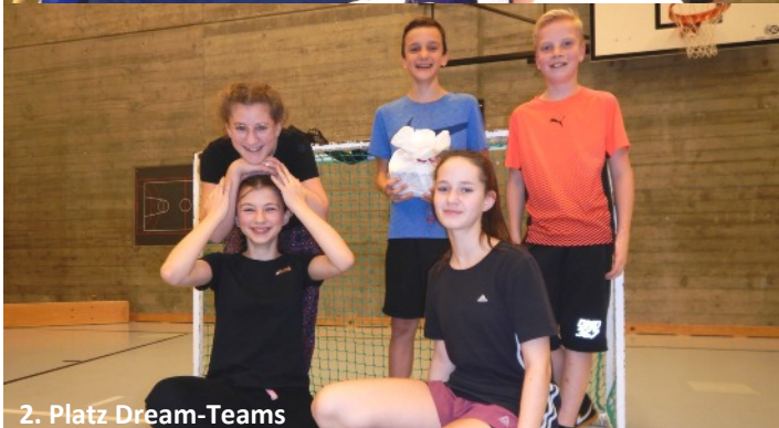
2. Platz Dream-Teams