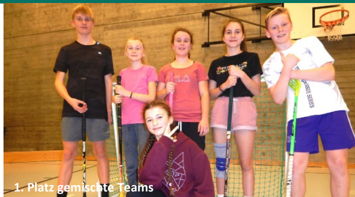
1. Platz gemischte Teams