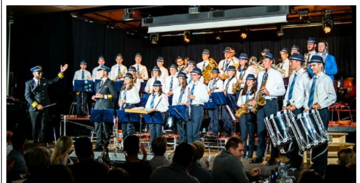
Korps und Tambouren an den Abendunterhaltungen 2018

Wir freuen uns, dir unsere Instrumente und unser Verein näherbringen zu dürfen. Lueg doch ine!