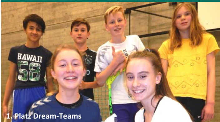
1. Platz Dream-Teams