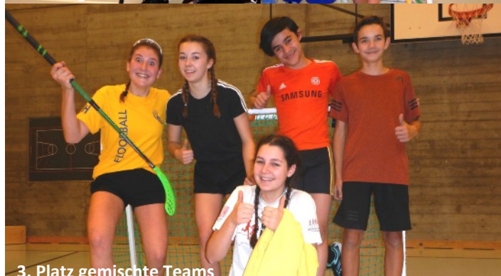
3. Platz gemischte Teams

Am 20.12.18 haben sich alle Jugendlichen der Schule Wolf-