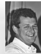
Hans Schmid Regie