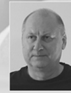
Beat Wyss Foto / Video