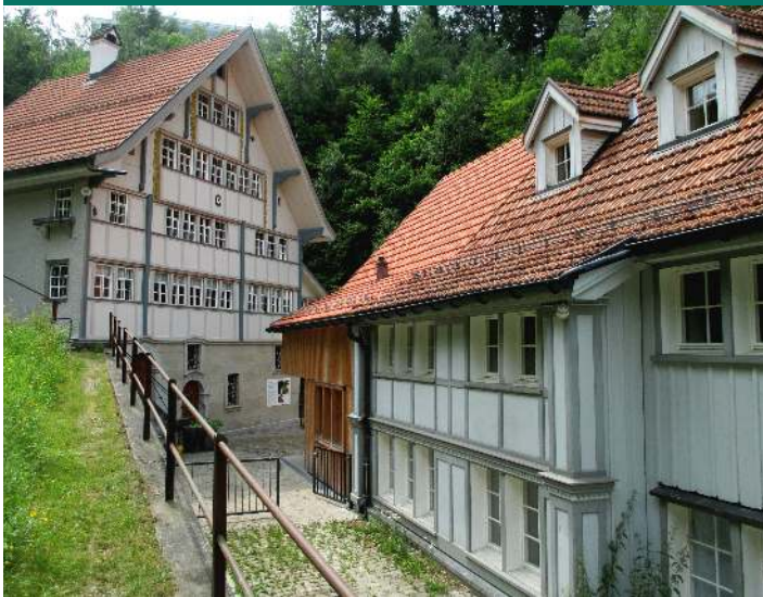
Alte Mühle wird liebevoll gepflegt

Die Alte Mühle in Wolfhalden gehört zu den schönsten historischen Bauwerken weit und breit. Das unter Denkmalschutz stehende Gebäude wird von Idealisten liebevoll gepflegt und soll mit einem Wasserrad weiter aufgewertet werden.