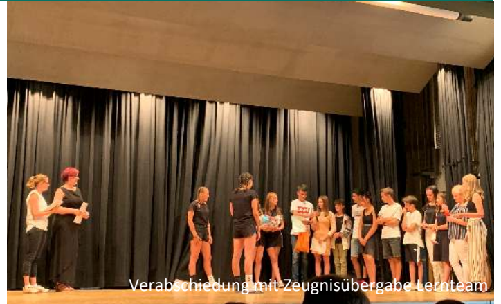
Verabschiedung mit Zeugnisübergabe Lernteam