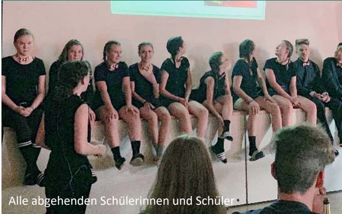
Alle abgehenden Schülerinnen und Schüler