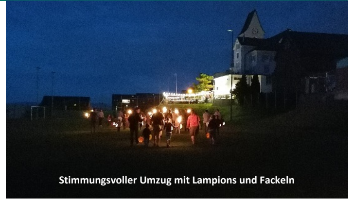
Stimmungsvoller Umzug mit Lampions und Fackeln

Ein reichhaltiges Kuchenbuffet hatten die Frauen des FTVs aufgefahren. Während der Feier flitzten sie zwischen den Tischen, dem Grill und dem Tresen hin und her, um die rund 120 Gäste nicht auf dem Trockenen sitzen zu lassen. Die Nachfrage nach Pommes war so gross, dass es leider zu längeren Wartezeiten kam. Fürs nächste Jahr werden wir dies verbes-