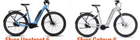
Flyer Upstreet 5 statt Fr. 4800.– jetzt Fr. 3499.– Flyer Gotour 6 statt Fr. 4500.– jetzt Fr. 3499.–