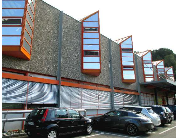
40 Jahre alt: Das an die Webereifabrik angegliederte Filinox-Industriegebäude wurde 1979 bezogen.

Die steigende Nachfrage nach Geweben unterschiedlichster Feinheitsgrade für Filterzwecke aller Art (Wasser, Abwasser), Siebdruck und stark zunehmend für die Mikroelektronik führte zu Engpässen in der Versorgung mit feinsten Drähten. Deshalb wurde mit der 1979 erfolgten Gründung der Tochterfirma Filinox AG und dem Bau eines weiteren Fabrikge-