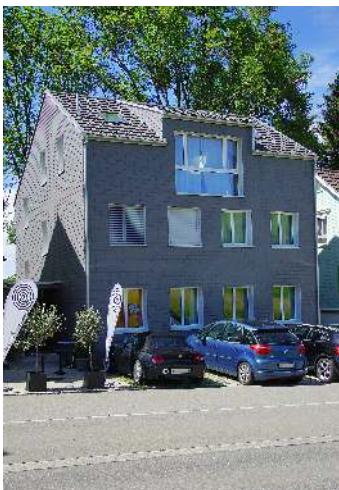
Teeladen in Hinterergeten eröffnet

Mit der Eröffnung des Tee- und Gewürzladens "Focusana" (gesunder Fokus) ist der Detailhandel in unserer Gemeinde erweitert worden. Das neue Geschäft befindet sich im wiederaufgebauten Brandobjekt Hinterergeten 113 direkt an der Hauptstrasse nach Heiden.