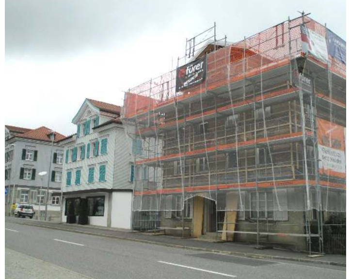
Nachdem das Gemeindehaus und das Elektra-Gebäude bereits saniert worden sind, wird jetzt das benachbarte Haus Nummer 40 umfassend erneuert (von links).

Eine Reihe stattlicher Häuser säumt die Hauptstrasse im Ortskern von Wolfhalden. Die derzeitige Sanierung eines Gebäudes ist ein weiterer Beitrag zur Verschönerung des Ortsbildes.