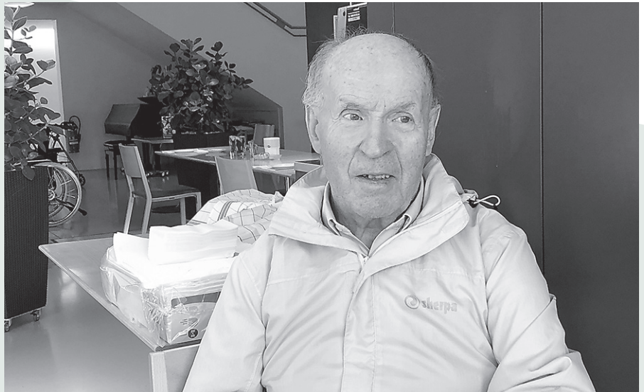
Bruno Frei (12. Oktober 1935 bis 19. Januar 2021)

Als im Zuge der Armee-Verkleinerung die starke Herabstufung oder gar Schliessung des Zeughauses Herisau drohte, setzte er sich